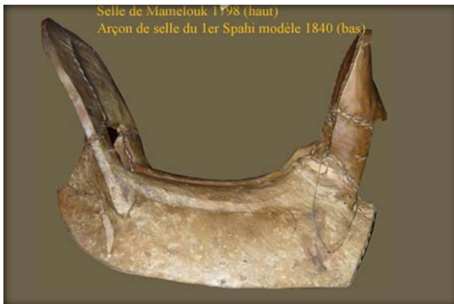
Figure 1 Arçon arabe

Deux taquets sont placés à l'arrière du troussequin pour l'étayer.